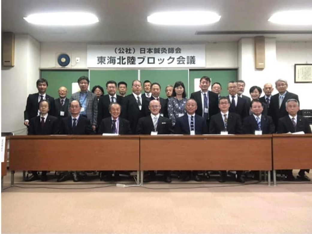
写真：「東海北陸ブロック会議（富山県）」 令和5年10月8日（日）、9日（月・祝）