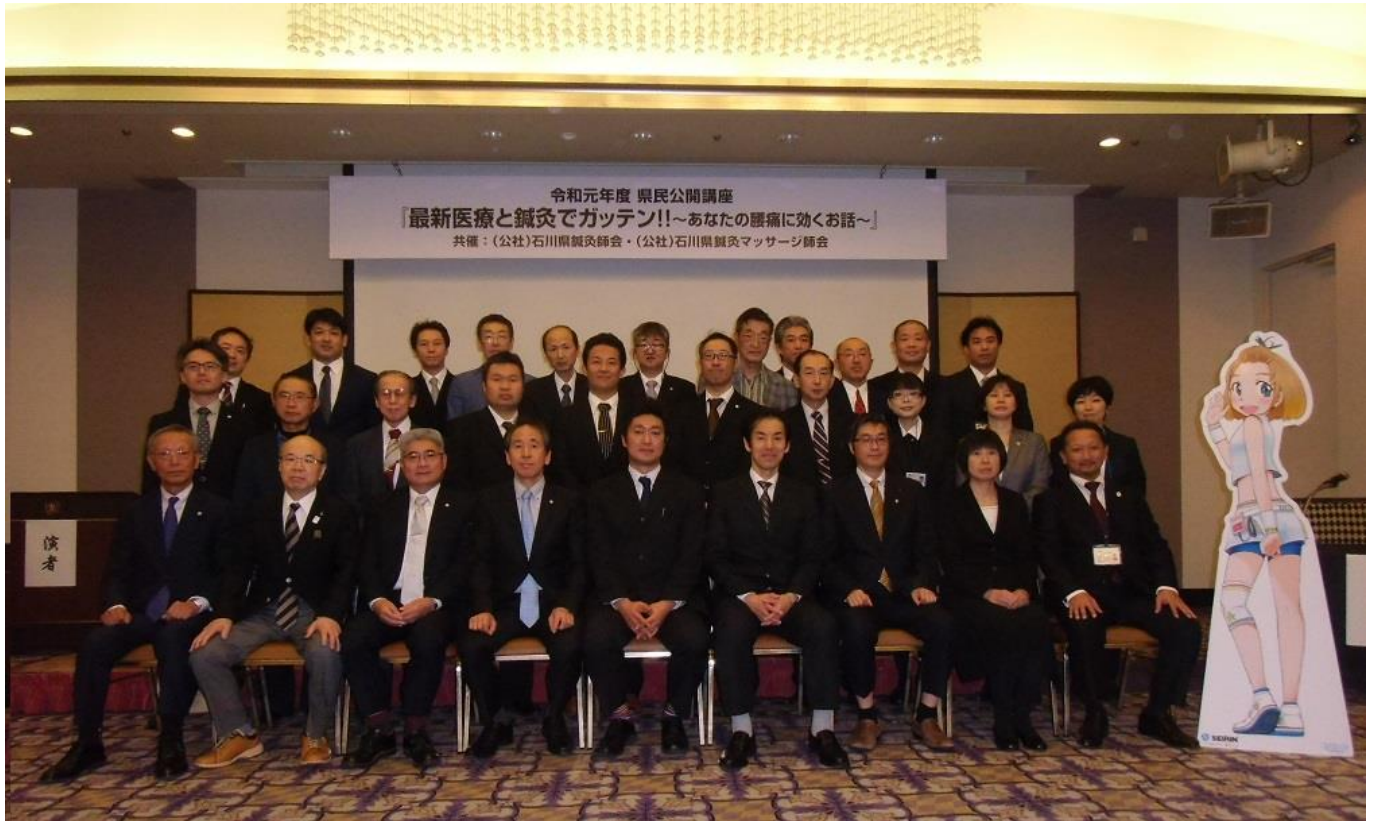
写真：「県民公開講座 最新医療と鍼灸でガッテン!! ~あなたの腰痛に効くお話~」 令和元年11月24日（日）